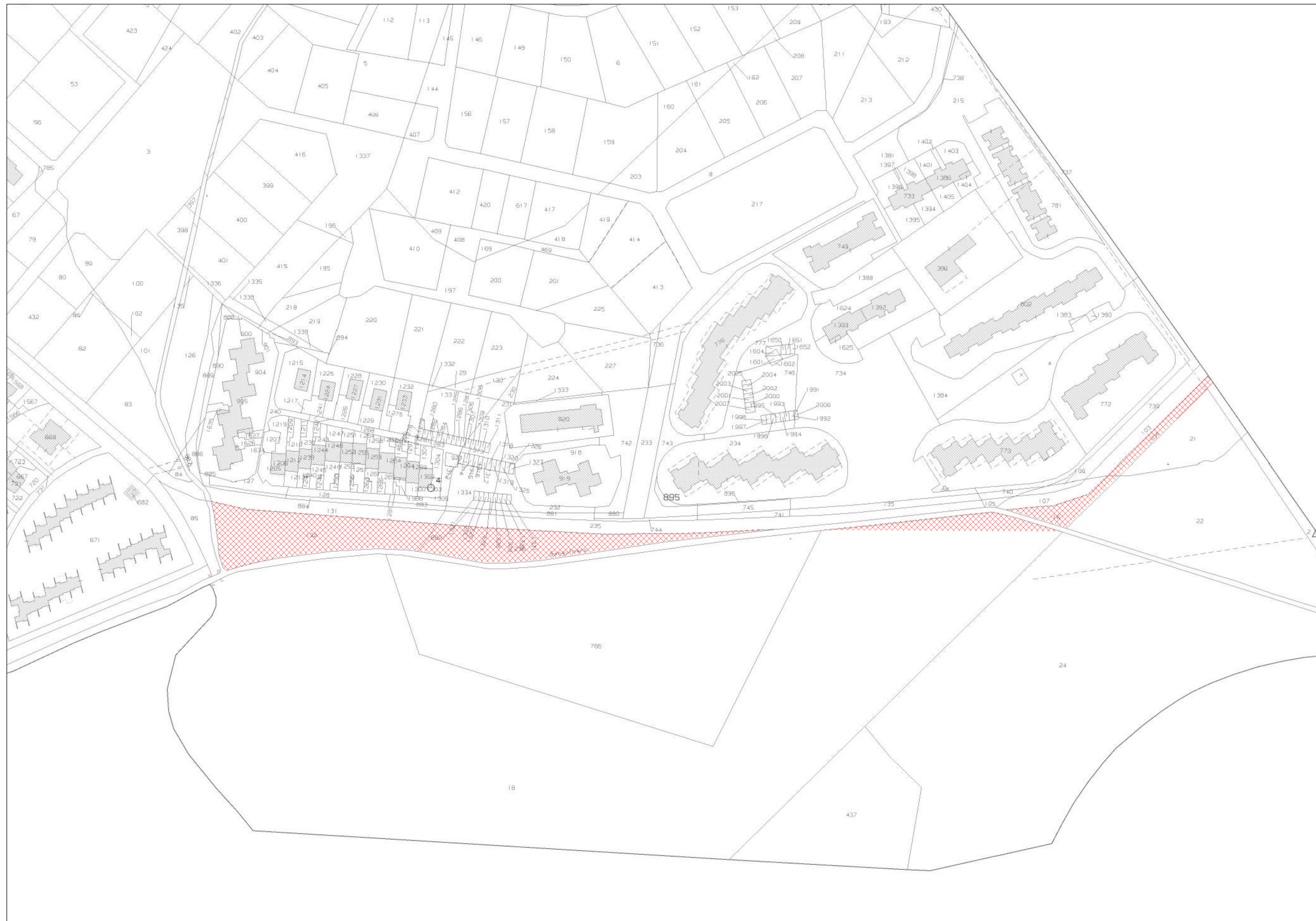
Stralcio catastale scala 1:1.000