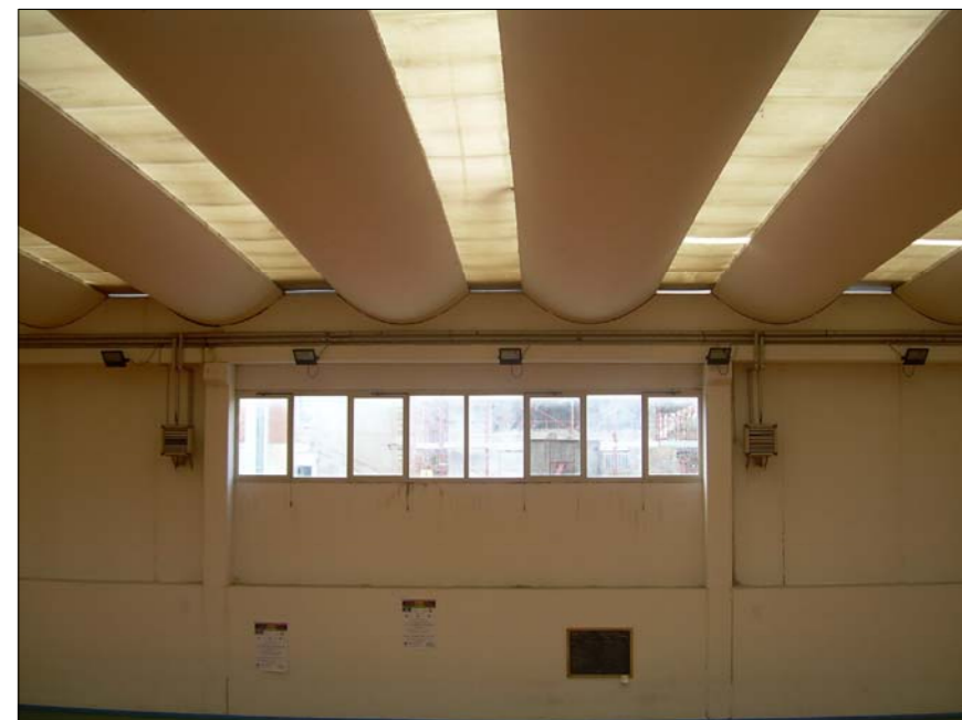
FOTOGRAFIA N° 8