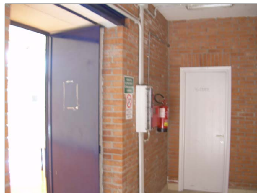
FOTOGRAFIA N° 10