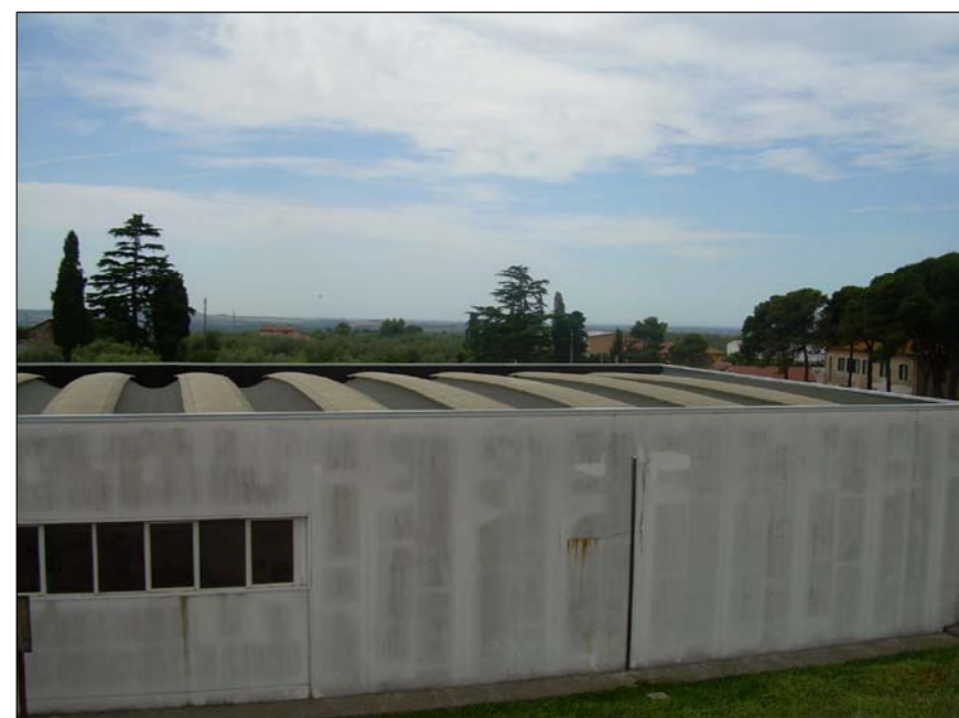
FOTOGRAFIA N° 6