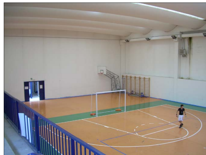
FOTOGRAFIA N° 9