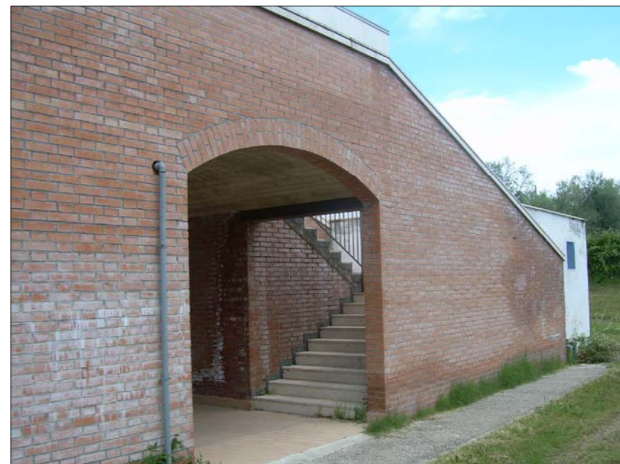
FOTOGRAFIA N° 5