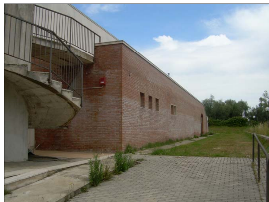
FOTOGRAFIA N° 4