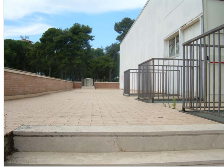
FOTOGRAFIA N° 7