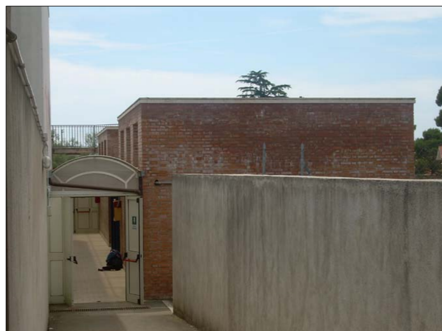
FOTOGRAFIA N° 1