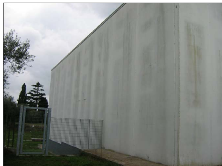
FOTOGRAFIA N° 3