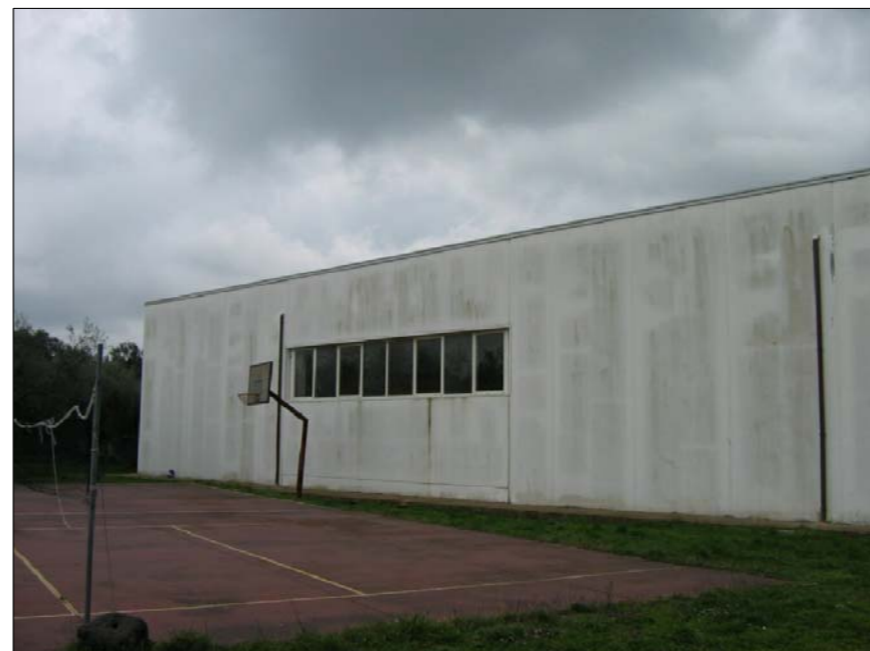
FOTOGRAFIA N° 2